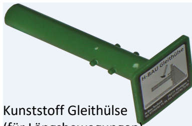
Kunststoff Gleithülse (für Längsbewegungen)