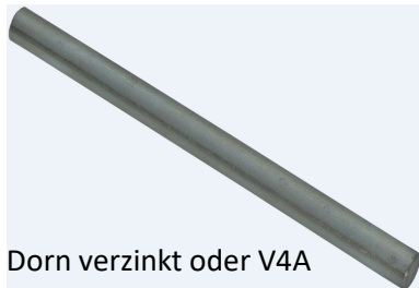
Dorn verzinkt oder V4A

Einzel Schubdorn in verzinkt oder V4A Ausführung zur Querkraftübertragung im Bereich von Dehnfugen. R90-Ausführung mittels Brandschutzmanschette lieferbar. Andere Durchmesser und Längen auf Anfrage.